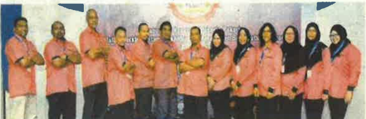
Barisan kepimpinan AUEGCAS negeri Perak yakin mampu menambah 500 ahli tahun depan.